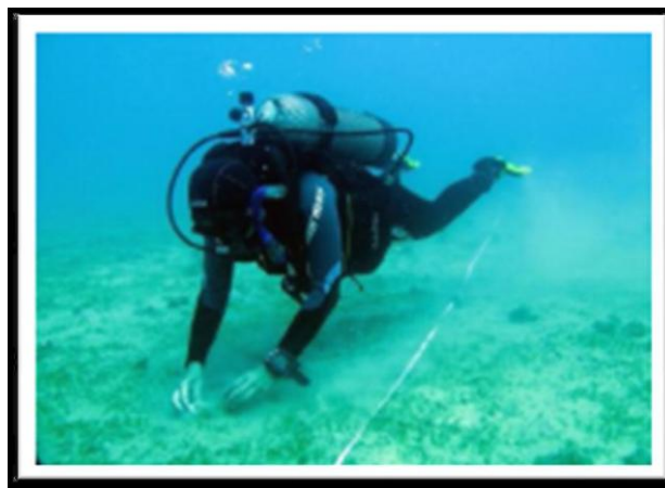
Figura 1 Coleta de amostras através de mergulho autônomo.

A metodologia do trabalho envolve mergulho para mapeamento dos tipos de fundo e coleta de amostras para realização de ensaios granulométricos ( Figura 1 ) e observações na topografia do recife. O processamento da base de dados obtidos será realizado através do programa ArcGIS, resultando em mapas temáticos ( Figura 2 ).