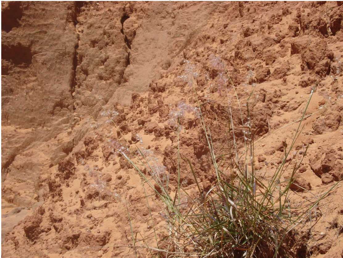
Figura 2 - Melinis repens , espécie identificada no interior da ravina e uma das poucas a colonizar os taludes. Foto de Carmem Lucas Vieira 09/11/2011.