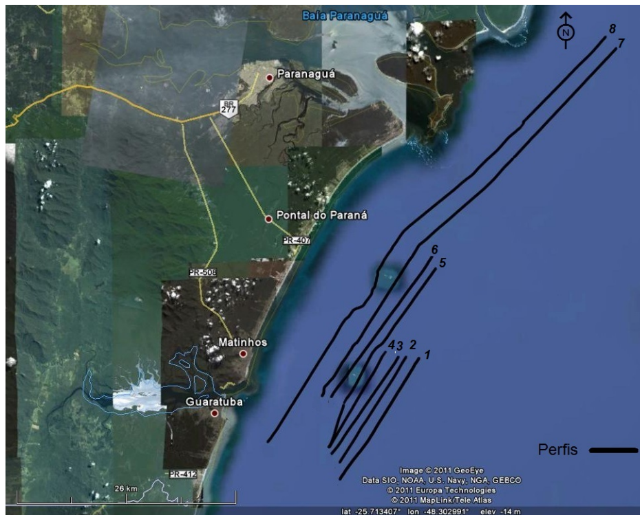
Figura 01 – Localização dos perfis geofísicos realizados no litoral paranaense.