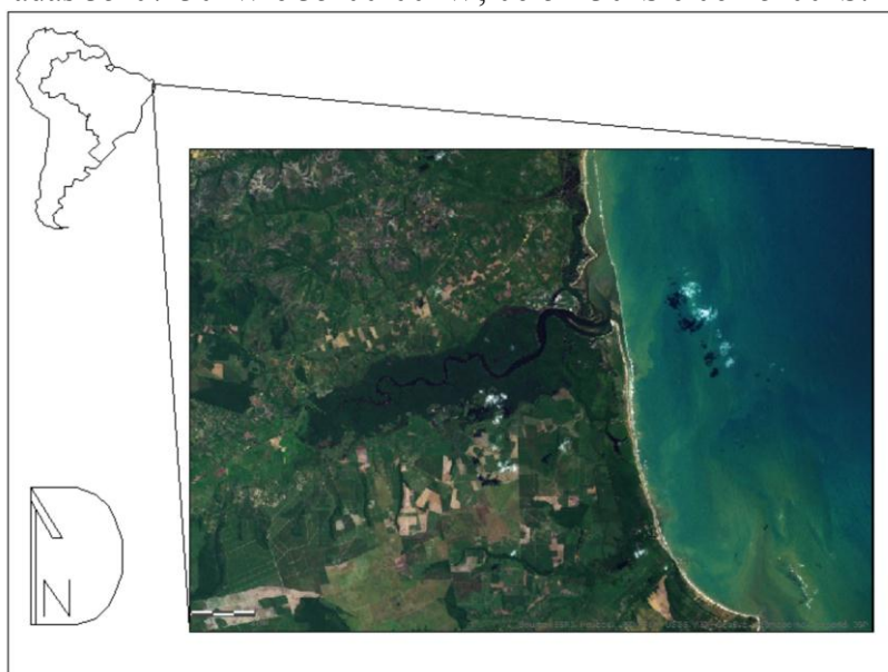
Figura 1 – Gráben do rio Mamanguape, litoral norte do estado da Paraíba.

O presente trabalho está inserido na carta topográfica Barra de Mamanguape, produzida pela SUDENE em 1974 e localiza-se no litoral norte do estado da Paraíba, com sua área delimitada entre as coordenadas 35°07'30"W e 35°00'00"W; 06°52'30"S e 06°45'00"S.